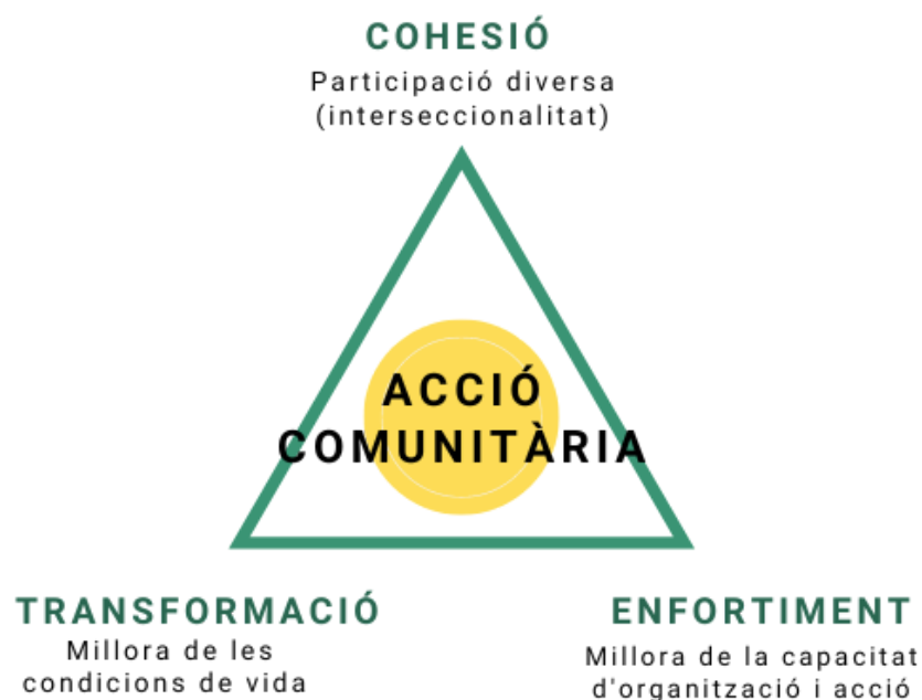
Figura 2. Acció Comunitària (Morales i Rebollo, 2014)

Es tractarà per tant d'accions col·lectives amb objectius col·lectius amb una triple intencionalitat i estratègia: promoure l'empoderament de la població, no generar exclusions incorporant les diversitats dels membres i grups i millorar les condicions de vida (Morales, Rebollo i González, 2016, pp. 11-12) (Morales i Rebollo, 2014, pp. 10-15).