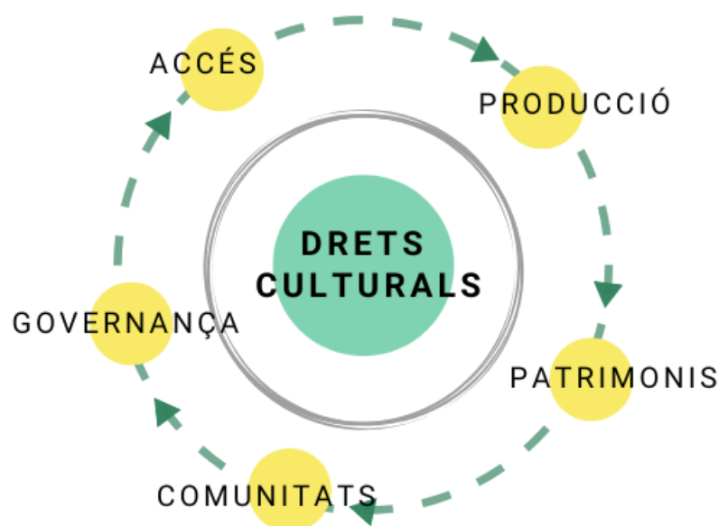
Figura 1. Drets culturals. Elaboració pròpia